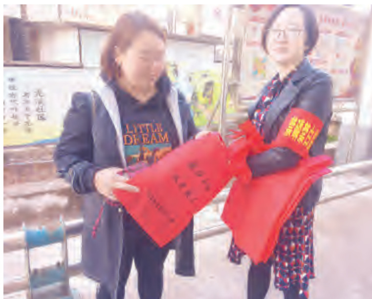
为加强居民健康意识，维护市容环境整洁，下关镇龙溪社区加大环保宣传力度，于10月10日在龙溪路开展保护洱海和禁磷、禁白宣传活动，利用买菜高峰期向广大市民宣传节约资源、保护环境知识，倡议广大市民不使用塑料制品装东西，减少白色污染的机会。