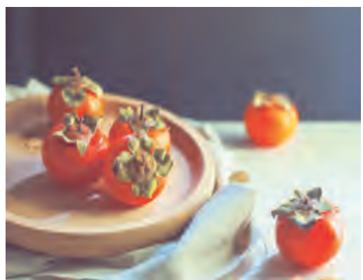
柿子是晚秋的灯笼 一串串挂在故乡 密密麻麻的柿红 就是一缕缕的乡思 点亮了我的乡愁

晚秋的红 故乡的柿子挂满天 一个个亮在枝头 像一盏盏灯笼 和着秋风秋雨的音符 温暖旅途中游子的心房