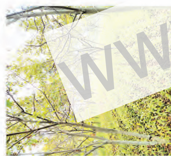
核桃林下中药材种植经营模式