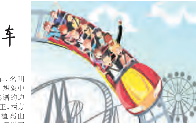
为自己带来灾难。这趟恐怖起落的云霄飞车旅程,正是某种“灾难体验”。

搭迪士尼的云霄飞车,不仅是搭云霄飞车,更是走进一个故事,体验故事。你可以借故事来转述自己已在列车上的感受,不会一开口除了说“好高、好快、好刺激”,就不知道讲什么了。