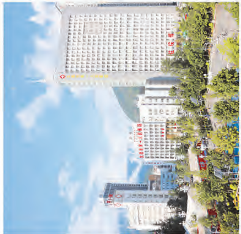
新建成的大理市第一人民医院