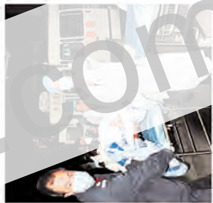
医疗条件逐步改善