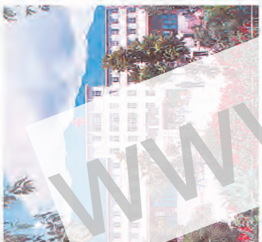
新建成的大理市第一人民医院