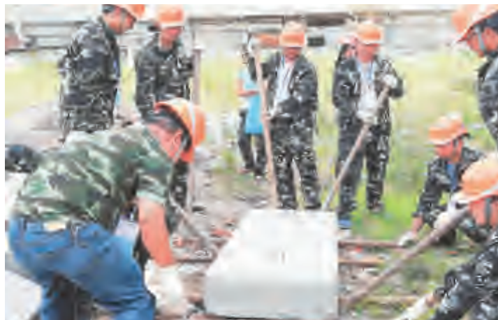
近日,省州市地震局、市政府应急办联合举办地震应急救援第一响应人培训班。通过培训,学员们学到了就第一时间在地震灾区开展应急响应相关地震科普知识、灾情信息收集与上报、地震救援组织管理、灾害形势评估与需求分析、建筑物结构知识、废墟救援评估、搜索技巧等最新地震应急救援理论知识和地震现场快速评估、基本救援、医疗救护等方面的实践技能。

凤仪镇要求各单位要统一思想,高度重视,按照职能职责及任务分解开展整治工作,建立长效工作机制,巩固工作成效,着力改善公路沿线环境面貌,美化公路沿线景观,打造美丽公路,改善人居环境,提升城市形象。赵思兰