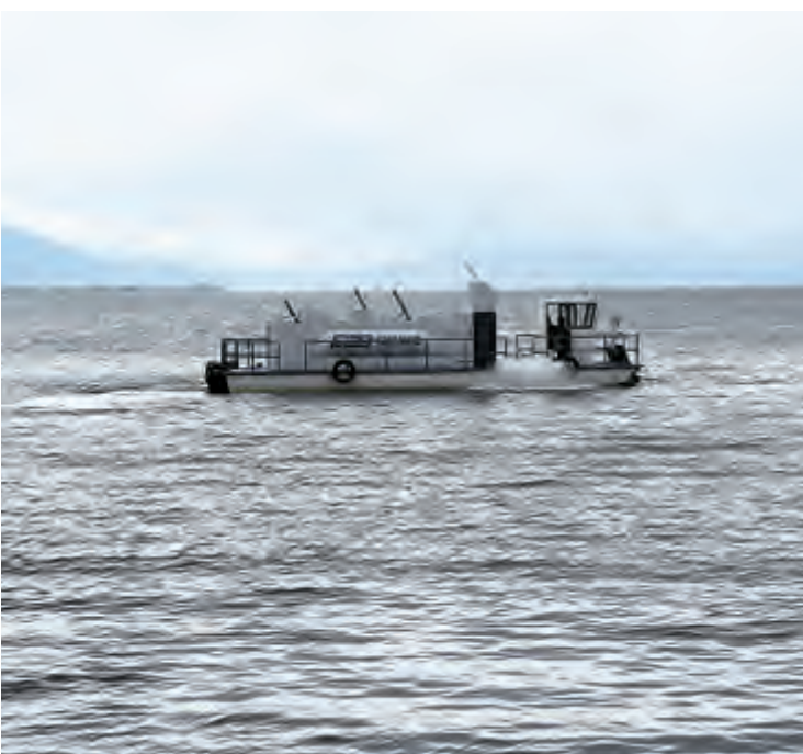
近年来,我市根据洱海保护治理需要,在双廊镇建成配备除藻船及除藻设备的藻水分离站和水上打捞平台,在才村码头实施除藻试验示范工程。同时,组建以镇为单位、分片包干、分段管理的600人蓝藻专业打捞队伍,洱海蓝藻防控取得初步成效。

9月18日,市政协九届二次会议重点提案专题协商会召开,听取承办单位对5件重点提案的答复,听取提案者的协商意见。 市政协九届二次会议以来,政协委员深入调查研究,提出了许多有份量、有分析、有具体建议的提案,内容涉及经济建设、文化建设、社会建设、城市建设、生态文明建设等方面,反映民声、表达民意、汇聚民智。市政协对征集的365件提案进行认真细致的审查,共立案331件,立案率为91%。 会上,市洱管局、市文明办、市住建局、市城管局、大理海东开发管委会分别对《关于改革创新洱海保护“三线”划定后沿海村民搬迁安抚政策,保障移民正常生产生活的提案》《关于积极推进文明城市创建长效机制建设,提升城市综合管理水平的提案》《关于促进房地产业健康发展的提案》《关于强力推进厕所革命的提案》《关于加快商贸物流园区建设的提案》5件重点提案办理情况进行通报。提案者就提案内容与各部门进行协商,对提案办理落实情况表示满意。 市委副书记、市长杜淑敢出席会议并讲话。杜淑敢充分肯定了市政协重点提案办理工作,通报了近期经济社会发展情况,对5个重点提案办理工作进展情况作了补充说明。 会上,市政协主席薛伟民就下一步抓好政协委员提案办理工作提出要求。他要求各有关部门要高度重视,提高认识,充分认识政协委员提案办理工作的重要意义;要加强沟通,强化落实,不断提高政协委员提案办理实效。 市政协副主席钟益民、郑一川、杨晓涛参加会议。市政协副主席乐松主持主持会议。 记者 彭黎明