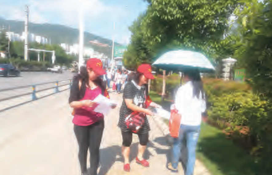
为提高居民的消防安全意识,近日,下关镇福文社区组织科普志愿者走上街头,开展消防安全宣传活动。活动中,志愿者们向过往行人发放《火灾逃生“七十二字口诀”》《消防安全告知书》等宣传资料,同时对辖区酒店、客运站等进行消防安全排查,宣传安全用电、用火知识,在社区中形成人人讲安全、处处重防范的良好氛围。