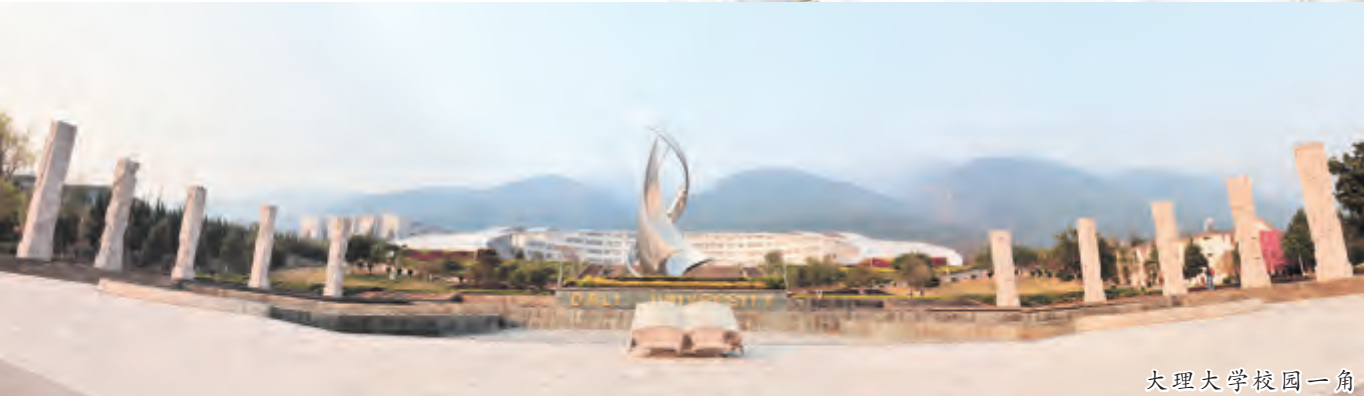
大理大学校园一角