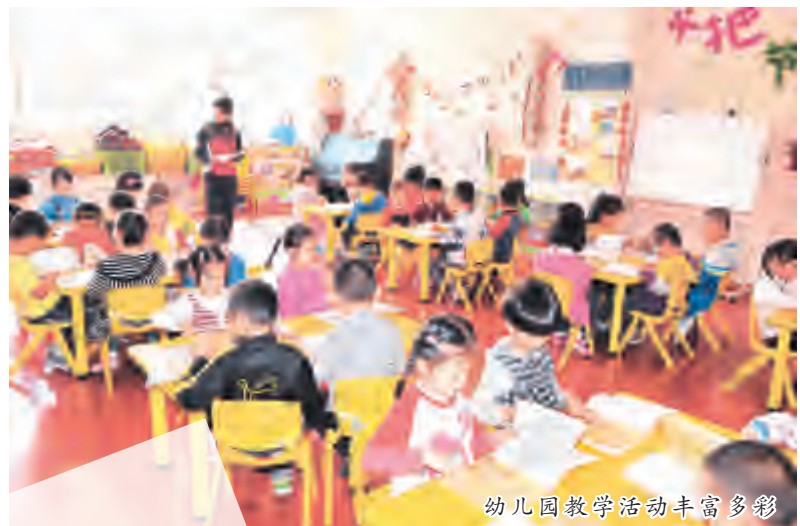
幼儿园教学活动丰富多彩

或许是由于一种职业的习惯,每当向外地朋友介绍起大理,笔者都无不自豪地认为:大理,就是让人一辈子最想在此读书的地方。然而,这样的说法并非没有根据。