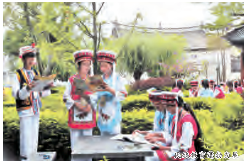
民族教育蓬勃发展

通过实施土地流转、产业到户补助、金融扶持、与龙头企业建立利益联结机制、合作社分红、劳动力转移培训等各项产业扶持政策,我市目前已实现符合条件的建档立卡贫困户均享受1至2项以上的产业扶贫项目,剩余901户丧失劳动能力的贫困户,已纳入低保或农村分散供养兜底,真正通过产业扶持,实现稳定脱贫。