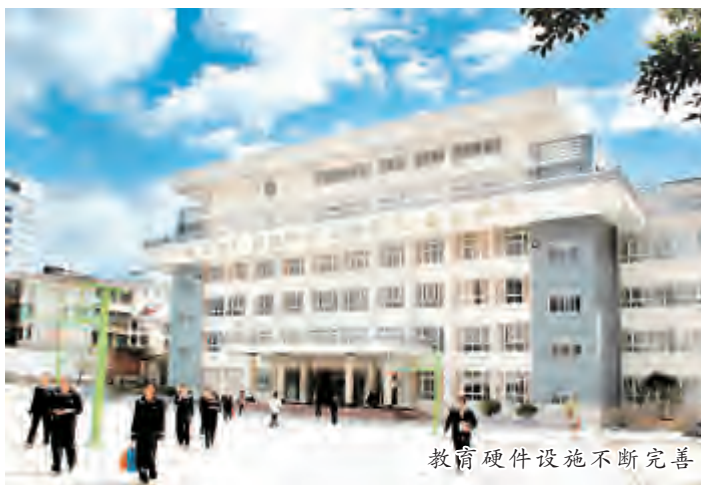
教育硬件设施不断完善