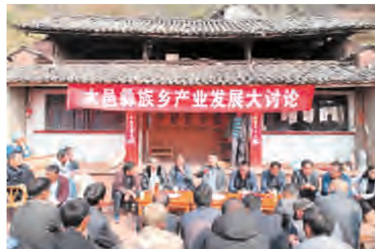
大理县彝族乡产业发展大讨论