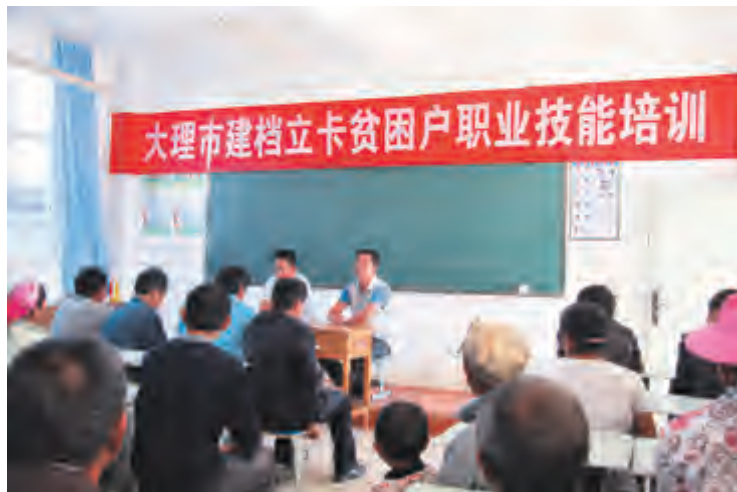
大理市建档立卡贫困户职业技能培训

市委、市政府先后出台《关于举全市之力打赢脱贫攻坚战的意见》《大理市关于进一步加快推进产业扶贫的意见》《大理市实施高原特色农业助力脱贫攻坚三年行动计划》《大理市就业创业精准扶贫三年行动计划》等相关政策,着力培育壮大烤烟、蔬菜、蚕桑、生物药业、特色水果、特色花卉等高原特色农业和劳动力转移培训项目,着力打好产业扶贫政策“组合拳”。组建成立大理市产业扶贫开发工作领导小组,先后召开大理市扶贫开发工作领导组第13次会议及产业扶贫工作推进会、大理市产业扶贫规划编制工作会议,明确全市产业扶贫发展思路、目标任务和具体措施,编制完善全市相关产业扶贫精准规划、年度实施方案和产业需求清单,扎实推进全市产业扶贫进程。