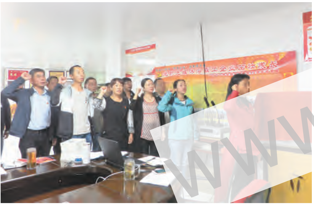
6月11日,云台山林业局机关党支部为6月份入党的同志过“政治生日”,向他们发放《政治生日贺卡》《习近平谈治国理政》(第二卷),集体学习《云南省共产党员“政治生日”制度(试行)》,重温入党誓词,党员们纷纷发表感言,回顾当年许下的承诺,回望自己政治生命的起点。图为云台山林业局机关党支部党员重温入党誓词。

建立现代财政制度。建立健全规范透明、标准科学、约束有力的现代财政制度。认真落实“三保”责任,严格按照保障顺序安排支出,大力压缩一般性支出,切实提高资金使用效益。着力硬化预算约束,坚持先预算后支出,严格执行人民代表大会批准的预算,严控预算调整和调剂事项。全面实施绩效管理,将绩效理念和办法融入预算编制、执行和监督的全过程,建立预算安排与绩效目标、资金使用效果挂钩的激励约束机制。持续推进“放管服”改革,精简行政审批事项,严格落实“双随机、一公开”制度,常态化开展财政监督检查。 左兴亮