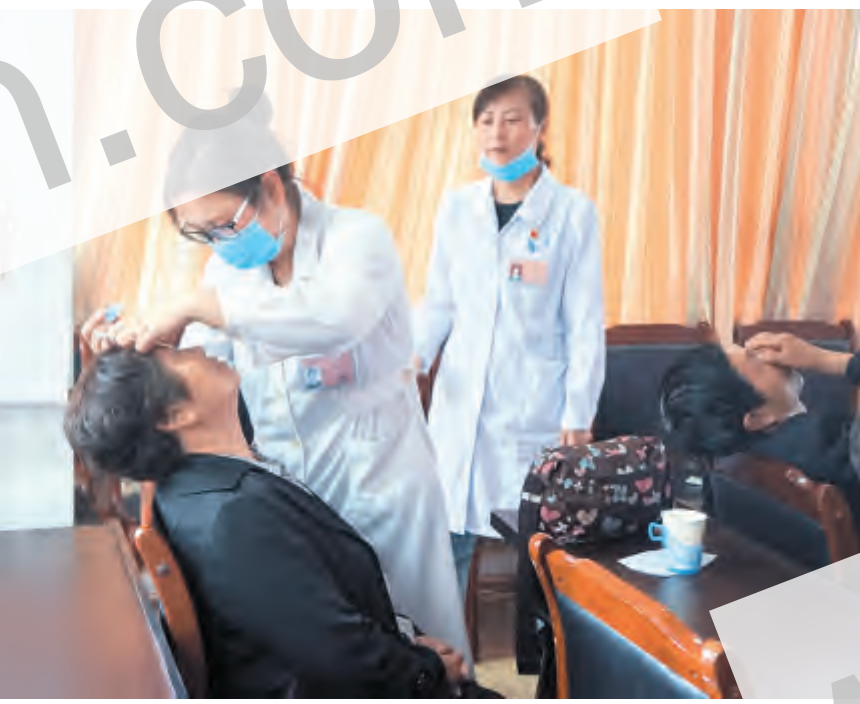
为帮助老年人远离眼疾,6月1日,下关镇西大街社区携手州医院眼科开展免费的眼病筛查、检查糖尿病视网膜病变及其他眼病等志愿服务活动。活动中,志愿者们为辖区老年人提供细致的眼病检查,普及眼病防治知识,解答眼保健知识,得到老年人及家属好评。