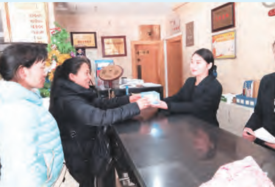
加强反腐倡廉建设 树立清正廉明之风

为进一步强化经济责任审计质量和成效,今年以来,市审计局多措并举深化经济责任审计工作,以加强对党政主要领导干部的监督管理,推进党风廉政建设,促进地方经济健康发展。 完善计划管理。市审计局对经济责任审计对象进行分类管理和计划轮审。根据领导干部管理资金资产资源规模、权力大小等因素,确定重点审计对象和审计周期,逐步加大任中审计比例,科学制订中长期审计计划和年度计划,为审计监督全覆盖奠定基础。 强化审计内容。在开展财政财务收支审计的基础上,市审计局重点关注权力审批、责任目标、重大项目、重要经济事项管理、审计整改等方面,全面监督领导干部守法、守纪、守规及尽责情况。 创新审计手段。在审计过程中,市审计局在利用传统财务台账的基础上,建立全市一、二级财政预算单位电子数据库,通过计算机审计,在筛选、比对、分析等环节上节约时间,提高工作效率。 深化成果落实。为进一步突出审计成果,有效促进审计查出问题的整改落实,市审计局不仅关注违规资金的整改,更关注各项政策措施落实。针对查出的问题,及时提出整改意见,充分发挥审计监督职能,确保在监管资金安全的同时促进各项政策措施落到实处。唐林