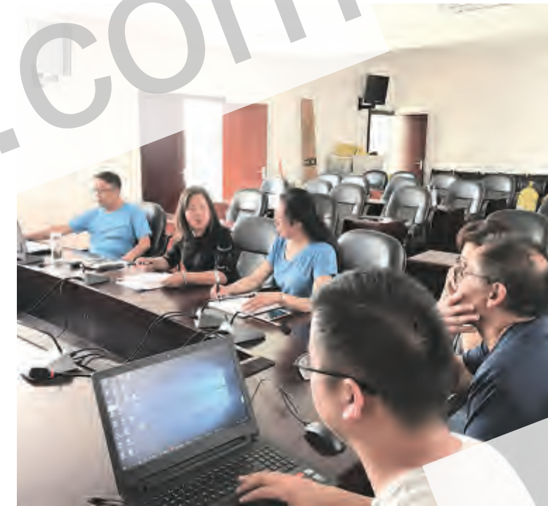
为提升党校教师教学水平,更好地服务全市干部教育培训工作,5月21日,市委党校举行教师授课讲评活动。活动针对近期市委党校开设的《党的十九大精神》和《习近平新时代中国特色社会主义思想》等课程的讲授情况,对每一位授课教师进行讲评,总结经验,为今后党校教师授课讲评活动提供优良借鉴。

第十六条 任何单位和个人应当自觉维护乡村清洁,禁止下列行为: (一)擅自或在公共场所、乡村道路、田间堆放、丢弃、倾倒垃圾、渣土等废弃物; (二)擅自或在公共场所、乡村道路打场晒粮、晾晒物品,堆放粪便、秸秆、建筑材料、杂物; (三)在田间、沟渠、河流、池塘、水库、湖泊等弃置农药、化肥包装物,农用薄膜、育苗器具等农业生产废弃物; (四)向沟渠、河流、池塘、水库、湖泊等直接排放粪便、污水,丢弃动物尸体,倾倒垃圾等废弃物; (五)在非指定地点堆放、弃置、倾倒或者抛撒建筑垃圾。(待续)