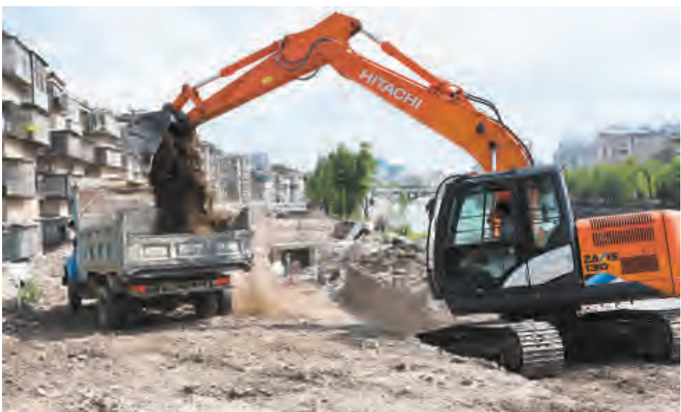
洱海流域截污治污工程“百日攻坚战大会战”启动以来，我市各级各相关部门采取倒排工期、挂图作战等措施，严格按照按量推进各项工程，确保上半年实现洱海流域截污治污工程全覆盖。图为美登桥至龙潭桥段截污治污工程加紧施工中。