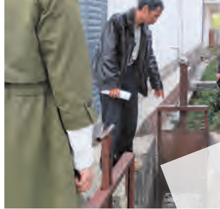
上关镇认真落实州市“三清洁”会议精神

求,上关镇近日组织召开洱海保护治理工作推进会。会议传达了学习了州洱海流域“三清洁”观摩推进会议