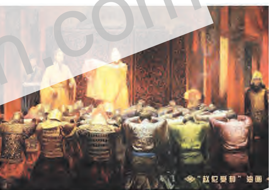
4月11日,大理市博物馆与广州南越王宫博物馆联合举办的《“赵佗——岭南开发第一人”图片展》在市博物馆四合院开展。此次展览是市博物馆四合院展区揭顶维修后引进的第一个展览,以图文并茂的形式向观众展现赵佗辉煌灿烂的一生,以及他为统一岭南创造安定局面、“和辑百越”促进民族融合、推动南岳地区经济文化发展、维护国家统一所做出的巨大贡献。展览为期一个月,欢迎广大市民前往参观。

近日,市公安局古城派出所民警通过细致工作,成功帮助一拾得人找回遗失的两万元钱。 4月5日,赵先生向民警派出所报警称其摆放在家里的两万元钱被盗,警方接警后,接警后,民警立即带领值班人员赶往赵先生家开展现场勘查及调查走访工作。经过调查,民警发现赵先生之前将两万元钱放在一纸箱内保存,将纸箱当作废纸板卖给在村里流动收废旧物品的两名陌生男女。4月8日,赵先生再次向古城派出所报警,称其在下关找到了当时收废报纸的两名男女,请警方帮忙追回两万元钱。接警后,民警及时驾车赶往下关,经过耐心细致地说服教育工作,收废旧物品的两名男女将两万元钱如数归还赵先生。 王彦