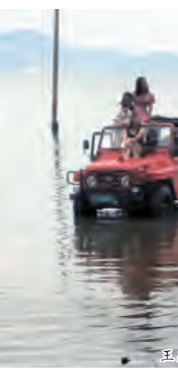
王某某上传的照片