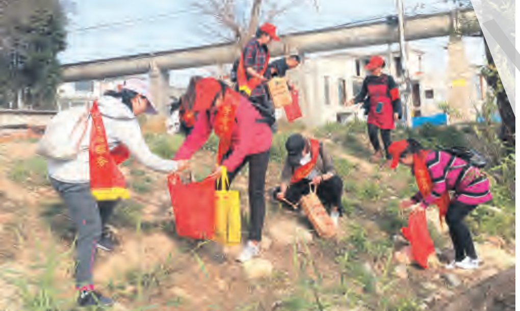
近日，下关镇兴盛社区组织志愿者开展“保护洱海”志愿服务活动，深入大理全民健身中心至茭萼村环海西路段田间地头，清理丢弃的农用地膜、农药包装袋等垃圾，清理田间沟渠，开展文明劝导。通过努力，田间地头的白色垃圾减少了许多，受到当地村民的肯定与赞许。