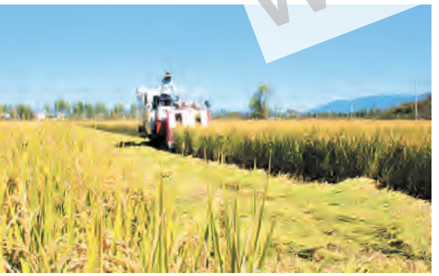
大理十月稻金黄,田间地头收割忙。眼下正是秋收时节,连日来,我市各乡镇农民正全力以赴收获金秋灿灿的稻谷,田间地头处处呈现喜人的丰收景象。图为湾桥镇古生村村民在收割稻谷。 记者 李世奇 摄 李俊波

杜淑敢要求,全市各级各部门要充分肯定成绩、认真总结经验,坚定打赢打好精准脱贫攻坚战的信心和决心;要清醒认清形势,持续发力攻坚,精准务实抓好脱贫攻坚各项任务,进一步聚焦产业发展、拓宽增收渠道,聚焦基础建