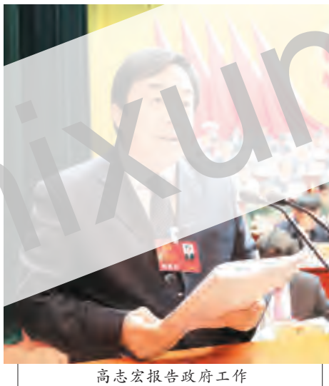
高志宏报告政府工作