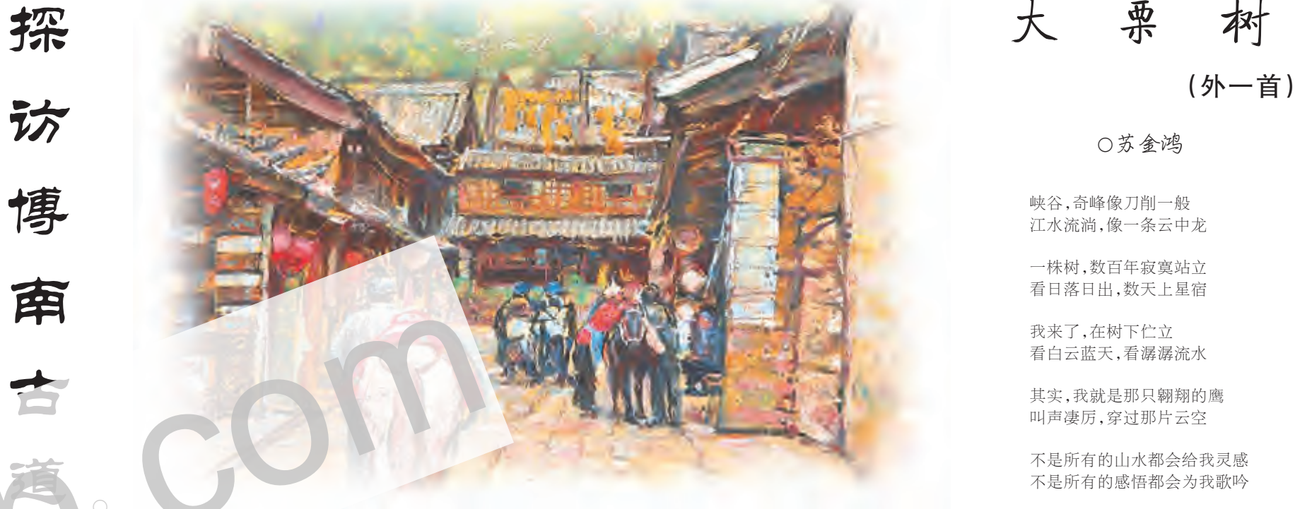
大理时讯 大理时讯数字报刊平台 www.dalishixun.com