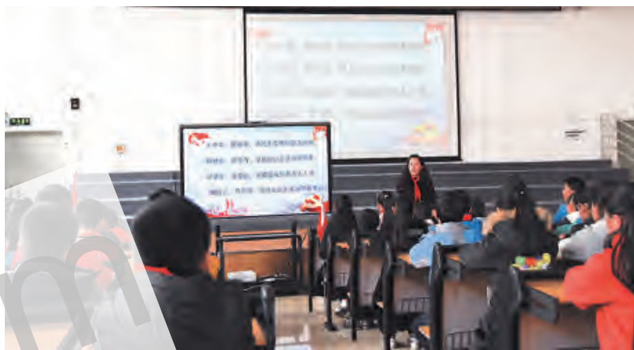
2017年12月28日,为深入学习宣传贯彻党的十九大精神,鼓励少先队员以自身的实际行动争做新时代好队员,下关四小211中队组织开展了《学习十九大精神,争做新时代好队员》主题班会。活动中,队员们通过观看动画视频《我们的新时代》,深入了解党的十九大精神。随后,通过诗朗诵、学习弘扬社会主义核心价值观的二十四字童谣、畅谈心中感想等方式,让队员们加深了对党的十九大精神的认识,并深刻感受到了中华民族的悠久历史和辉煌成就。

海东镇 2017年12月29日,正值全市上下掀起学习贯彻党的十九大精神之际,海东镇邀请市委宣讲团成员、市委党校培训科科长王进才作十九大精神专题宣讲。