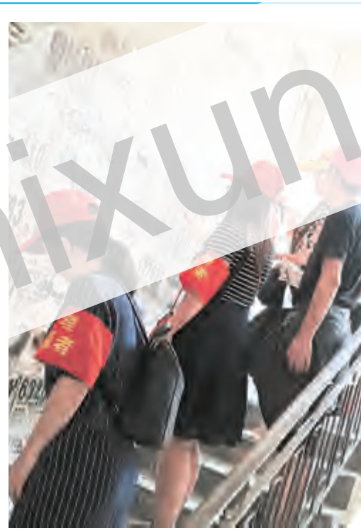
志愿服务 助推创城