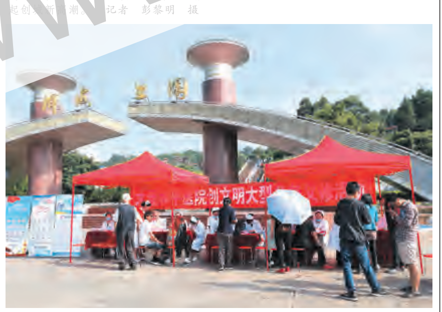
经开区组织辖区医院开展公益义诊活动

7月30日，大理经济技术开发区组织辖区医院开展公益义诊活动，来自大理和平医院5个科室的20多名医护人员顶着烈日，用爱心为每一名前来咨询、就诊的市民服务，受到了广大市民的好评。据了解，这是经开区组织开展的创建全国文明城市系列活动之一，自我市创建全国文明城市冲刺阶段以来，经开区先后多次组织力量，开展形式多样的文明创建活动，进一步掀起创建全国文明城市的热潮。