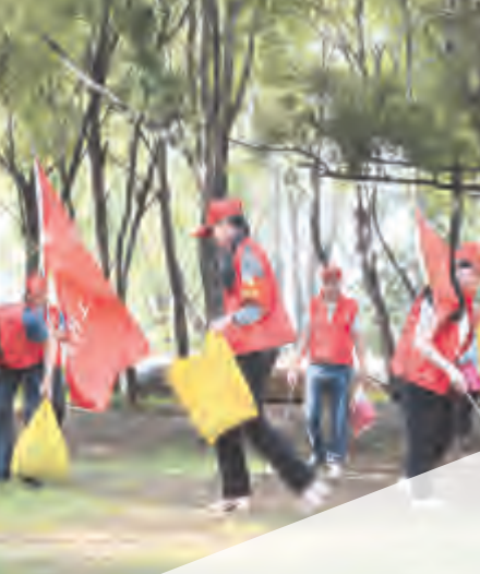
7月27日,挖色镇在洱海边开展以“洱海保护”为主题的创建全国文明城市志愿服务