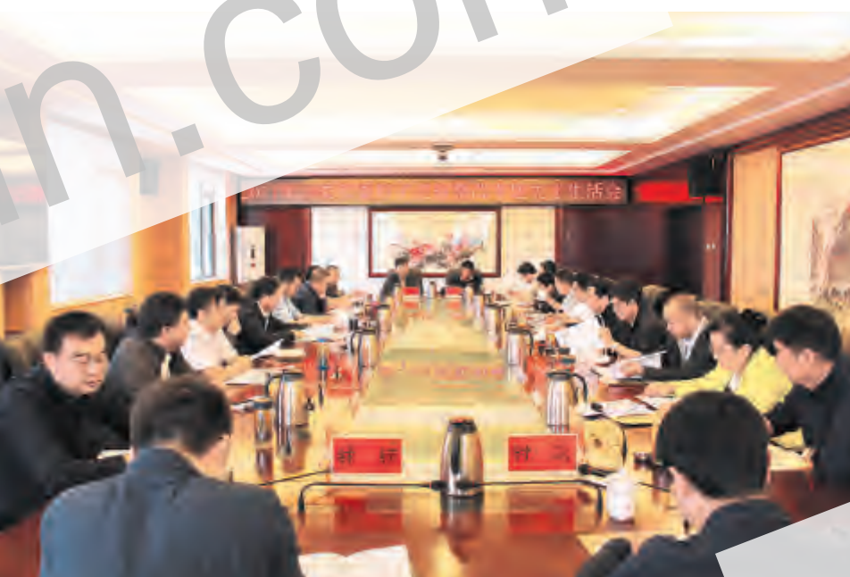
市委常委会班子巡视整改专题民主生活会现场

孔贵华在总结讲话中指出,此次专题民主生活会围绕构建良好党内政治生态,以“贯彻习近平总书记系列重要讲话精神,认真做好巡视整改工作,推动政治生态明显改善”为主题,聚焦政治站位、政治意识、政治纪律、政治功能发挥4个方面开展党性分析,从学习贯彻落实习近平总书记系列重要讲话精神和中央部署要求、执行政治纪律和政治规矩、组织生活、作风建设、履行“两个责任”5个方面深入查摆突出问题,坚持高标准、严要求,认真开展批评和自我批评,是一次定位严、批评