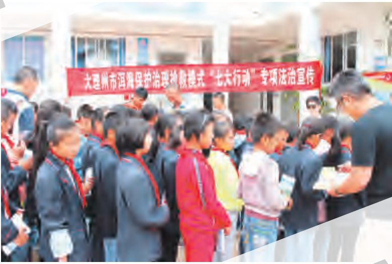
大理客运站推行“校园直通车”运营新模式。