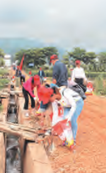
洱海镇社区党员开展主题党日活动。

6月28日,下关镇洱海社区党总支开展系列活动,庆祝中国共产党建党96周年。社区90多名党员面对党旗,重温入党誓词,进一步激发党员的政治热情,增强宗旨意识,大家纷纷表示要讲党性、作奉献,在洱海保护治理中率先垂范,以实际行动保护洱海。