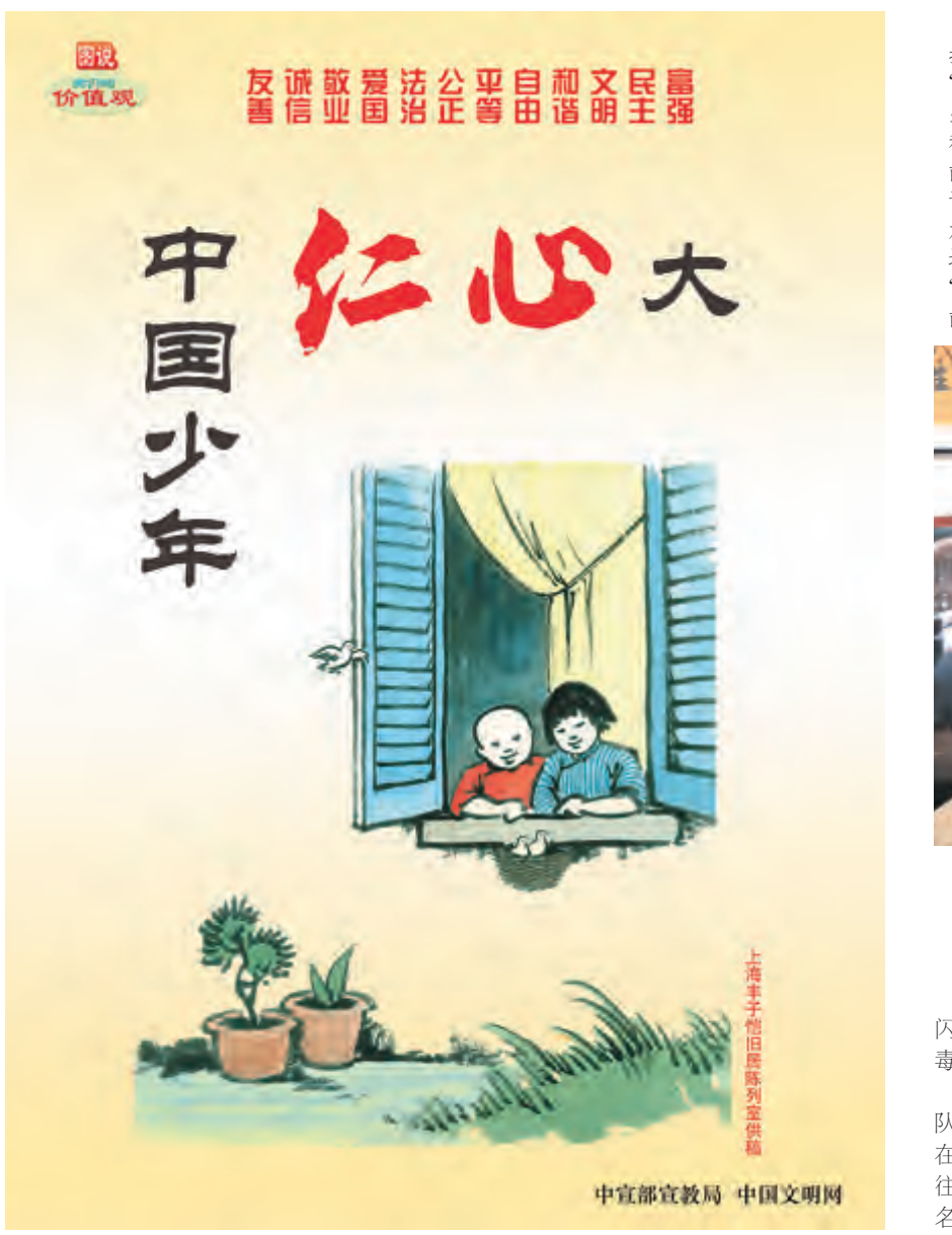
中国少年 红心大 人文大理更精彩