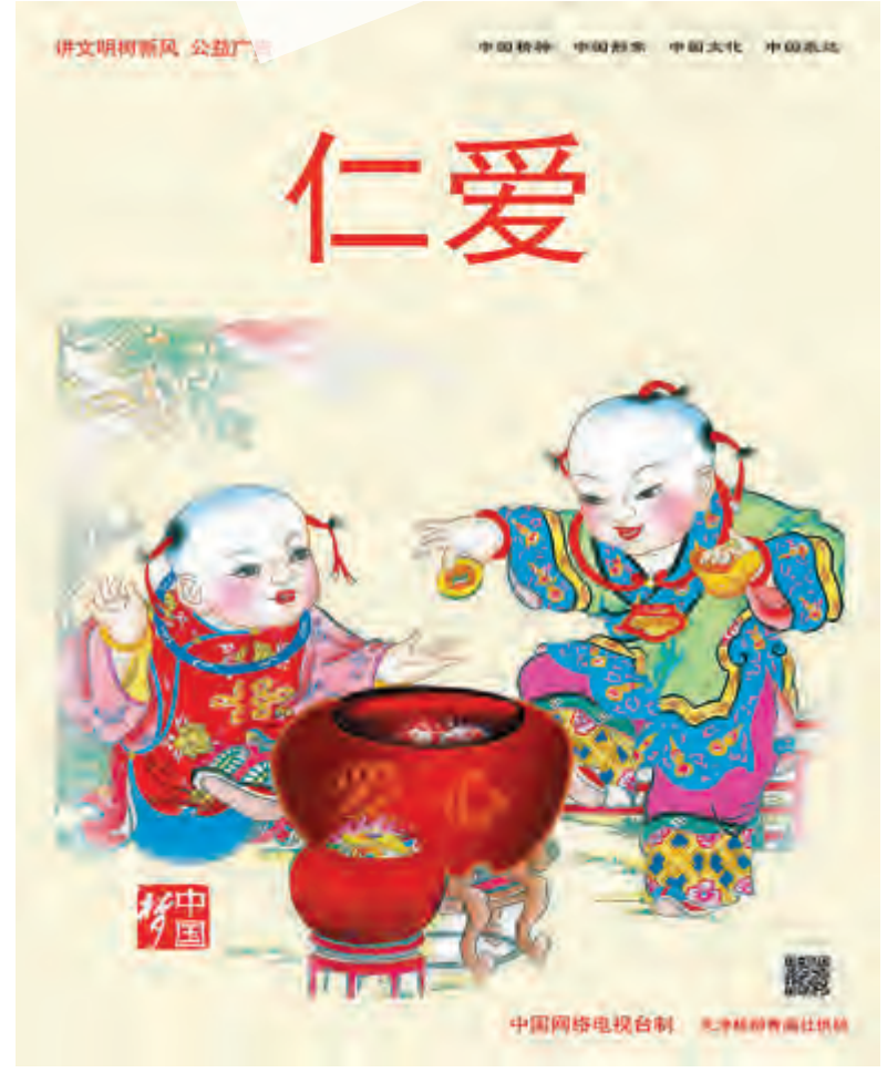
中国网络电视台制 吴静梅曹南社供稿