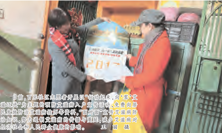
日前,百乐社区志愿者开展以“行动起来,向‘零’艾滋迈进”为主题的预防艾滋病入户宣传活动,免费向居民发放防治艾滋病宣传册,“面对面”宣传艾滋病防治知识,努力遏制艾滋病的传播与蔓延,减少艾滋病对经济社会和人民群众健康的影响。