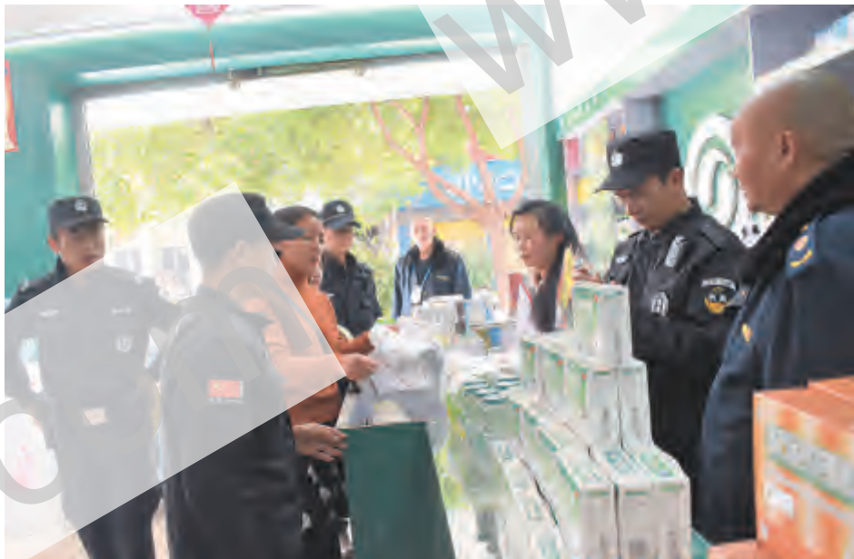
此次整治活动,积极倡导居民绿色消费,自觉拒绝使用塑料袋,进一步提高群众对一次性使用塑料制品危害性的意识。下一步工作中,凤仪镇将加大宣传力度,加强群众的环保意识,抵制白色垃圾,提倡绿色消费。

为进一步提升人民群众的环境保护意识,营造良好的生活环境,3月24日,凤仪城管分局联合市场监督管理所、凤仪派出所对凤仪城区开展洱海流域环境综合整治“禁白”专项整治活动。 整治组重点对凤中市场、凤中路的商家、店铺以及临时摊位进行了检查,对销售、使用一次性塑料购物袋和发泡塑料餐盒情况进行查处。通过检查,仍有部分商家使用无法降解塑料袋问题。对存在问题的商家,执法人员对当事人进行了现场教育,依法没收查处塑料袋。 当天检查共出动执法人员9人,出动执法车辆1辆,发放倡议书500份、白色污染宣传单500份,查获一次性塑料餐盒22公斤,有力制止了白色污染的传播,巩固了“禁白”成果,工作人员通过法律解读,发放节水、水土保持法律知识宣传册、法律知识读本以及水法宣传资料等形式,结合当前正在开展的洱海保护“七大行动”向市民宣传河湖及洱海保护知识。下一步,湾桥镇还将以“世界水日”为契机,拓展公众参与渠道,营造全社会共同关心河湖及保护洱海的良好氛围,通过构建责任明确、协调