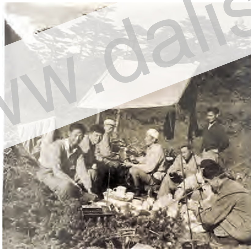
▲建设者在苍山上宿营(摄于1975年)

在架电杆的过程之中，其中最难架的是94号杆，它位于孤立险峻的石峰“狮子头”上，拉线多达24根，最长的一根长达130多米，70平方毫米的钢绞线采取每人扛一、二圈，50多人排成长龙一齐行动，搬运5天才到达山顶。杆与杆之间的距离长达1000米，放线时先在遍布杂木刺蓬的山地上劈开一条8米宽的通道，攀越险峰、跨过溪涧。架设工人就这样迎狂风、顶烈日、御严寒、战冰雪，历时一年零四个月，终于架通了全长9.7公里的10千伏高压输电线，1979年6月30日正式通电。总投资29.6万元，比原计划节约资金5.9万元。这6条银线似闪光的琴弦，飞舞在丛山峻岭之间，拨弄着高山流水般的神韵，给万年寂静的苍山带来了现代化的光明，似一颗璀璨的明星闪耀在苍山中和峰顶。