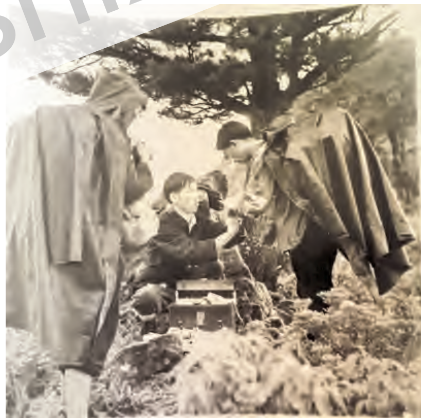
▲医生在苍山上为工作人员看病(摄于1976年)