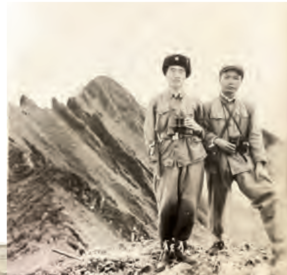
▲作者与同事在马龙峰(摄于1974年)