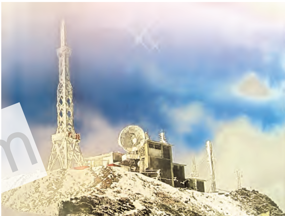
雄踞苍峰绝顶，傲视冰雪之巅； 傲居世界之巅，傲居世界之巅。