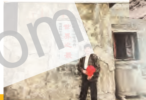
▲作者在苍山电视台机房前(摄于1999年)

不管时光过去多久，我那份对苍山的依恋，仍时时萦绕心头； 尽管岁月飞逝多年，我那种对电视的深情，仍久久眷恋依旧。 拾取那一桩桩难忘记忆，人生无不激荡着几许情怀； 回顾那一段段峥嵘岁月，内心无不充满着几多慷慨。