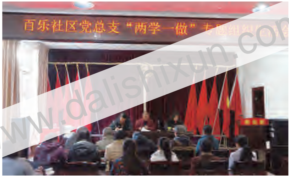
近日，下关镇百乐社区党总支组织各党支部负责人，认真学习《章程》、《中国共产党廉洁自律准则》等党纪党规、习近平总书记系列重要讲话精神，扎实推进“两学一做”学习教育，确保社区专题民主生活会及专题组织生活会开出质量、取得效果。