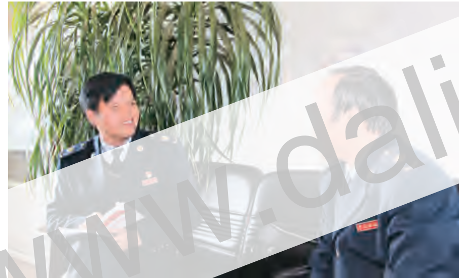
市地税局党的群众路线教育实践活动启动后,局领导深入基层一线,开展随机调研,虚心听取干部职工和纳税人的意见建议。对收集到的意见建议,主动反思,先行先做,立行立改,促进了活动的扎实开展与解决问题的同步推进。