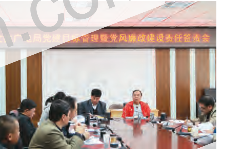
去年以来,市文体广电局党委通过认真学习和开展系列警示教育活动,进一步落实党风廉政建设责任制,连续三年在市级党风廉政建设目标责任制考核中,被考核为优秀。近日,市文体广电局召开党风廉政建设大会,签订责任书,并结合各下属单位工作实际,继续细化量化党风廉政建设责任制考核标准、风险和防范环节,确保党风廉政建设落到实处。