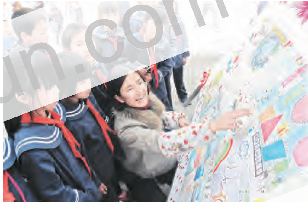
在洱海保护活动中,下关三小充分发挥学校教育宣传的主阵地作用,认真组织开... 保护洱海、从我做起”为主题,小手拉大手,发动学生... 行动争当“洱海保护”先锋,切实提高... 环保意识,并通过“小手拉大手”方式,带动家长共同保护环境,提高文明素质。