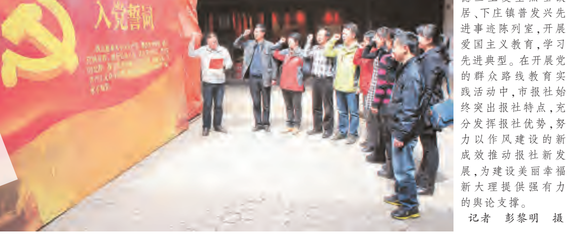
3月14日,大理日报社组织干部职工到祥云县王德三王复生烈士故居、下庄镇普发兴先进事迹陈列室,开展党的群众路线教育实践活动。在开展党的群众路线教育实践活动中,市报社始终突出报社特点,充分发挥报社优势,努力以作风建设的新成效推动报社新发展,为建设美丽幸福新大理提供强有力的舆论支撑。

兴公而忘私、为群众谋福利,清正廉洁、为群众办事实的朴素思想深深地感动,使每一位参观者深刻明白了践行“全心全意为人民服务”宗旨的责任和份量。