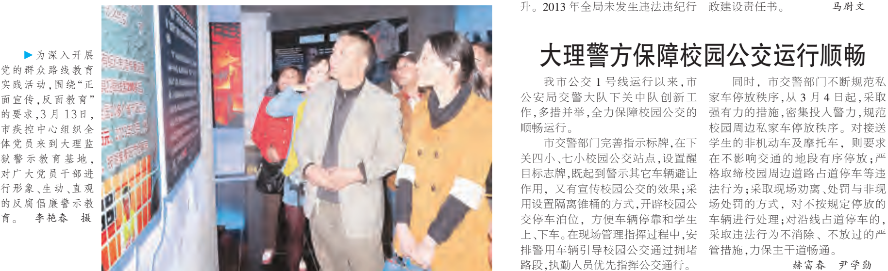
大理警方保障校园公交运行顺畅

为和被通报、问责情形,形成了抓落实、转作风、重服务的良好氛围。 会议要求,各党支部要继续深入学习贯彻十八届三中全会精神,一如既往地抓实党风廉政建设责任制,以为民务实廉洁为主题,以“照镜子、正衣冠、洗洗澡、治治病”为要求,不断推进党风廉政建设和反腐败工作深入开展。 会上,传达学习了中央、省、州、市各级领导的重要讲话精神及市纪委八届四次全会精神;局党组与各科室、市容秩序、环境卫生等部门签订了2014年度党风廉政建设责任书。 马蔚文