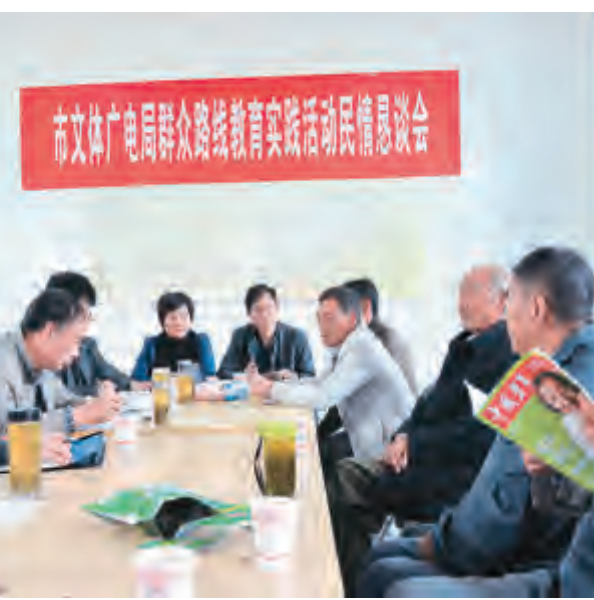
市文体广电局群众路线教育实践活动民情恳谈会。

3月5日,市住建局组织全局系统干部职工开展以“学雷锋,奉献社会”为主题的学雷锋志愿服务活动。市住建局与下关镇花园社区一道对环城南路“龙溪路至小花园段”进行环境卫生综合整治,以实际行动来积极推