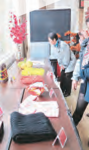
市工信局干部职工到挂钩村双廊镇育村开展民情恳谈活动。