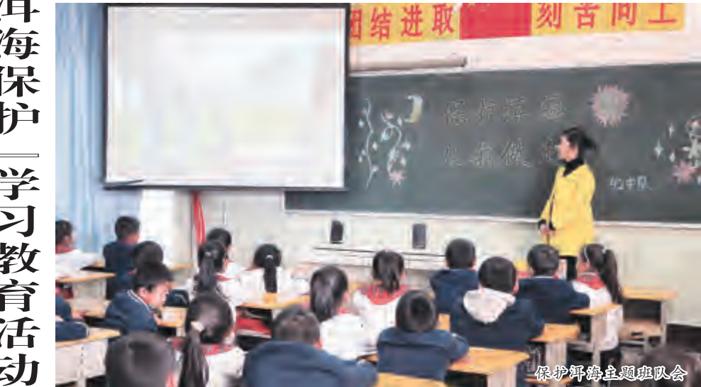
保护洱海主题队会