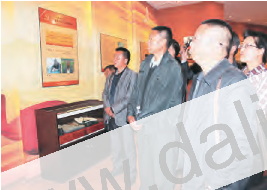
近日,湾桥镇委、镇政府组织党员干部、各村党总支书记集体到祥云王德三、王德生烈士故居,下庄镇普发兴事迹陈列室开展革命传统学习教育活动。革命、共产党员先进典型为教材,提升自我境界,树立良好形象,推动全市党的群众路线教育实践活动深入开展。