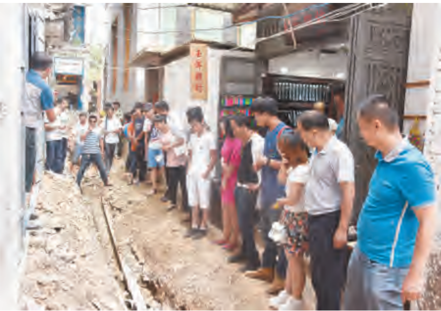
近日,双廊镇组织双廊客栈协会和双廊餐饮协会会员实地考察镇域环保设施建设和运行情况,自检自查部分会员环保工作情况,同时,召开座谈会,广开言路、集思广益探讨双廊镇未来环保工作突破口,为下一步双廊旅游产业发展出谋划策。