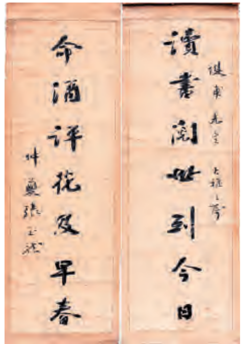
张玉龙 行书 对联·近代 纸本 147.5×40cm

张玉龙,字仲夔,清末民初云南大理人。武汉陆军学堂毕业,曾任军职及中学教师。书法学何绍基字体,笔法古朴。晚年信佛,远近寺观禅堂多有其屏联。