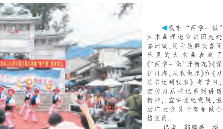
记者 郭鹏昌 摄影报道

大理大本曲理论宣讲团来到五星村,为广大党员和群众表演“抓‘两学一做’教育,干跨越发展实事,建全面小康大理”大本曲理论宣讲演出,演出受到了山区群众的热烈欢迎