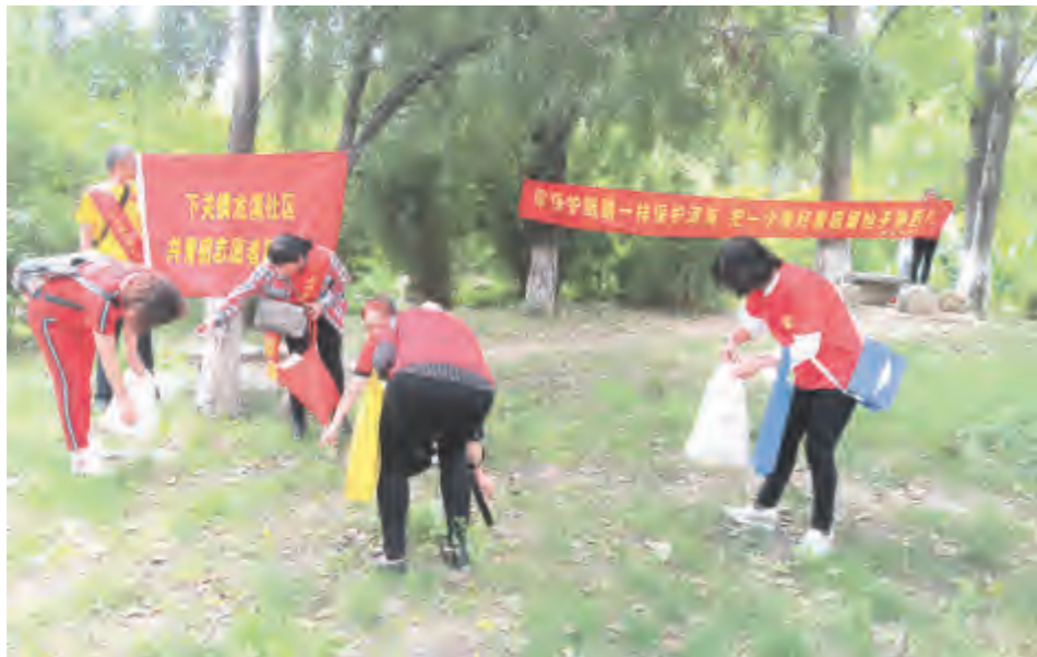
志愿者们正在清理洱海边的垃圾,并向路人发放《洱海保护知识读本》、《“禁白”知识宣传》等宣传资料300余份,宣传动员广大市民积极参与洱海保护志愿行列,用志愿服务精神助力文明城市创建。

为进一步引领社会道德风尚,进一步强化洱海保护责任意识,8月23日,下关镇龙溪社区组织志愿者队伍深入湿地公园开展以“讲文明·树新风”为主题的洱海保护宣传活动