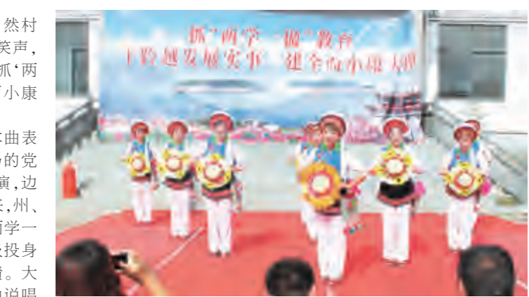
大理本曲演唱《保护洱海,从我做起》和《习总书记到我家》等节目,在传承和弘扬白族优秀传统文化的同时,倡导社会主义新风尚,歌颂社会主义新农村的新生活。

组织广大党员干部观看“两学一做”大本曲理论宣讲演出,对全镇的学习教育工作进行安排部署,掀起“抓‘两学一做’教育,干跨越发展实事,建全面小康大理”热潮,激励广大党员