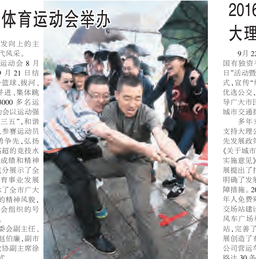
大理进程中奋发向上的主人翁精神和时代风采。此次职工运动会8月31日开赛到9月21日结束,共有男子篮球、拔河、旱龙舟、齐头并进、集体跳绳5个项目,3000多名运动员参加。运动会以运动强体魄,建功“十三五”,和谐奔小康为主题,参赛运动员顽强拼搏,奋勇争先,弘扬体育精神,以高超的竞技水平取得了比赛成绩和精神文明双丰收,充分展示了全市职工奋发向上的精神风貌,彰显了全市工会组织的号召力和凝聚力。市人大常委会副主任、市总工会主席赵伯廉,副市长缪锦辉,市政协副主席徐力进出席闭幕式。

9月22日,大理市公共汽车国有独资有限公司举行“无车日”活动暨支4路公交车开通仪式,宣传“绿色出行,城市未来,优选公交,绿色出行”的理念,倡导广大市民优选公共交通,缓解城市交通拥堵,减少环境污染。支4路票价1元,普通卡9折,学生卡7折,老年人免费,运行时间为6:30—21:30,计划日发车120班,每7—10分钟间隔发一班。