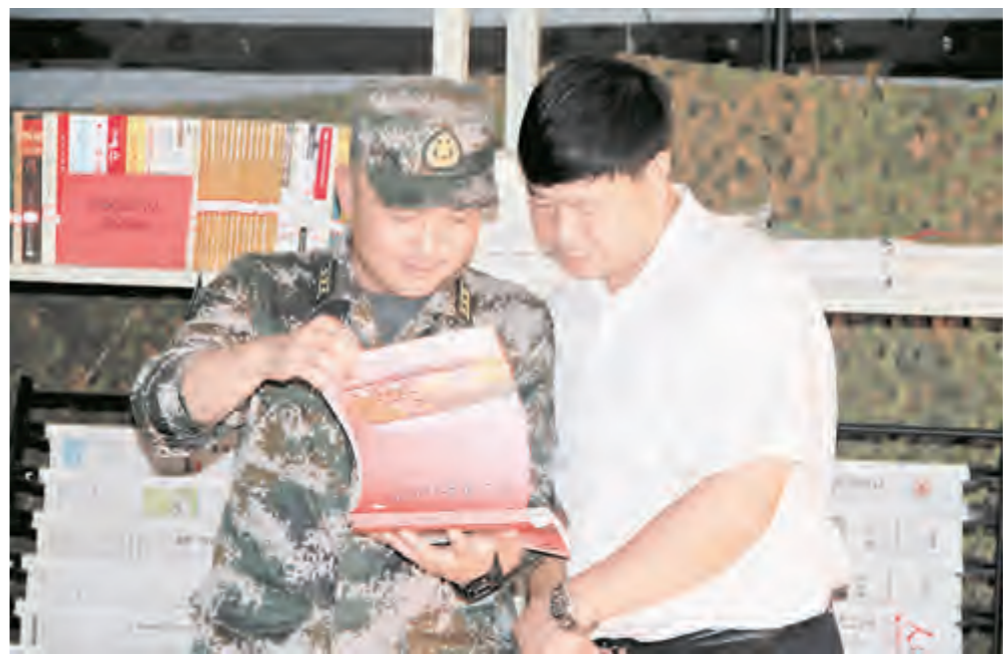
建行大理分行党委扎实推进基层党建工作,与驻地部队开展“两学一做”学习教育交流活动,相互学习借鉴好的经验和做法.图为双方领导在查看部队党员的手抄党章.

警示教育,每年组织一次党性分析,每年开展一次考核总结. 强化作风,着力打造过硬审计铁军.把廉政建设工作作为审计工作的“生命线”,把审计纪律作为审计人员的“高压线”,实行领导班子成员带头执行、职工自觉践行、制度规范落实的廉政纪律;坚持外树形象、内强素质的管理机制;坚持述职述廉、民主生活会等制度;坚持落实进点后公示审计纪律,出点后检查执纪情况,严格执行审计“八不准”纪律,自觉接受社会监督,着力打造作风过硬的审计干部队伍. 唐 林