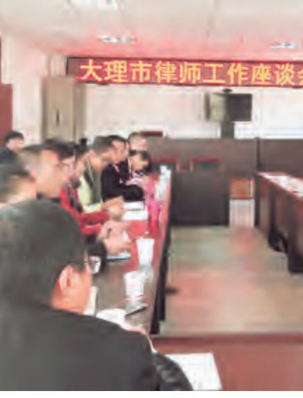
为落实全国、省、州、市律师工作会议精神,12月25日,市司法局召开律师工作座谈会,邀请市人大、市政协、市政法委相关领导到会作指导,市属9个律师事务所主任和律师代表就当前律师执业环境中存在的问题,做好下一步律师管理工作提出了意见和建议。市司法局要求各律所要加强管理,内强素质,规范执业行为,司法行政律师管理部门和律师协会要进一步畅通律师权益维护渠道,为广大律师做好服务。

同时,市旅管委与市辖区旅游企业(含)景区(点)签订了《大理市2015年“平安旅游”创建目标责任书》,做到层层签责、层层抓落实,把责任落实到市辖区旅游企业及旅管委机关,一抓到底不留死角。市旅管委全体干部职工还在年初签订了平安家庭责任书,承诺遵守国家的法律法规,承诺不参与“黄赌毒”任何形式的邪教组织、邪教活动,积极参加法律知识学习和宣传活动,不断提高法律意识,自觉抵制社会丑恶现象和违法犯罪行为,与乡邻和睦共处、团结友爱,带头构建平安社会和和谐家庭。在全市2015年度平安建设考核中,市旅管委平安建设工作被评为优秀等次。 张亚瑞