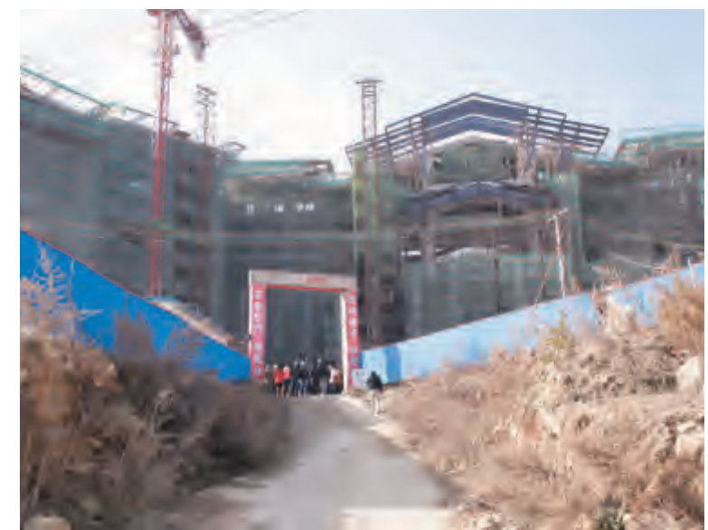
大理实力希尔顿酒店是“大理感通国际养生度假小镇”首期启动的项目,自2012年1月18日开工以来,酒店根据国际一流的设计,有序组织施工建设。目前,酒店主体工程已封顶断水,进入全面装修及设备采购安装阶段。