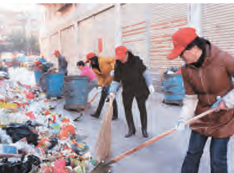
为进一步净化辖区环境卫生,美化街容街貌,切实改善人居环境,近日,下关镇宁和社区组织社区工作人员、志愿者等,开展辖区市容环境卫生整治活动。

住建部门担负着我市主要的民生工作,市政道路、供水、供气等市政公用设施建设与人民群众生产生活息息相关;城镇保障性住房建设、农村困难家庭危房改造直接关系到城乡中低收入家庭住房问题;房地产业和建筑业既关系经济发展,也关系民生改善。为促进全市住房和城乡建设工作新局面,深入开展教育实践活动,市住建局将紧紧围绕中央和省州市的部署要求,扎实抓好教育实践活动各个环节工作,准确把握中央和省州市党委的决策部署,以学习教