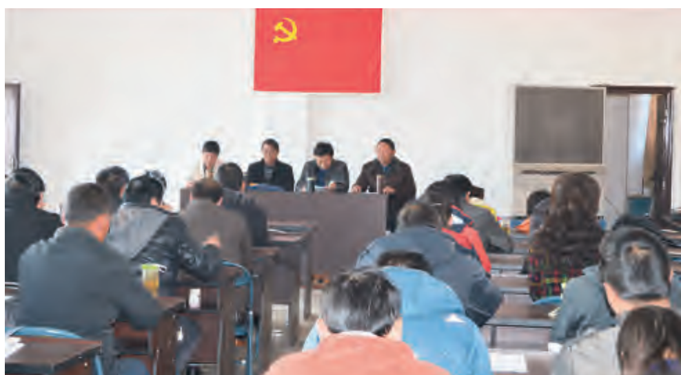
2月21日,市公交公司召开2014年党风廉政建设大会,传达学习中央、省、州、市党委关于加强党风廉政建设和反腐败工作的主要精神,通报公司2013年度党风廉政建设考核结果。公司主要领导与班子成员、各部门负责人分别签订了2014年度党风廉政建设责任书,为全面贯彻落实党风廉政建设奠定坚实基础。

在城区组织开展市容环境、交通秩序、市场秩序、社会治安、文化旅游环境等五大整治;在农村深入推进洱海流域百村综合整治、村容环境整治、拆违治乱整治、交通秩序整治等四大整治。加快实施大风路风光大道、苍山路、建设路等4条文明街道整治,集中打造下关中心片区和开发区片区、大理古城片区市容环境精品管理圈。按照以点带面,连点成片的思路,突出抓好重点村庄整治、部位整治、片区整治、道路整治,重点抓好下关镇、开发区和大理镇精品文明社区创建,优化提升城区环境卫生动态考核,建设整治优美的城乡环境。