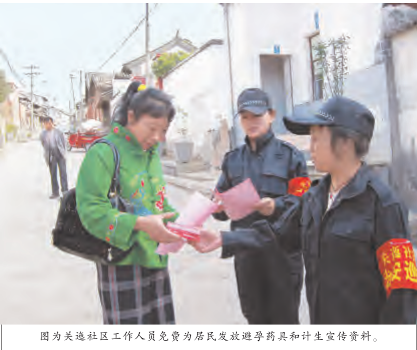
图为关迺社区工作人员免费为居民发放避孕药具和计生宣传资料。