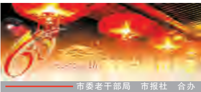
市委老干部局 市报社 合办

2008年,张志寿退休了,但是他没有停止对洱海的热爱,2009年初,他被州委、州政府聘为“洱海水污染综合防治督导组”,被市委、市政府聘为“洱海水污染综合防治组组长”,退休7年间,本来可以好好休养的他,因为怀着对洱海“母亲湖”的热爱,因为党委、政府的嘱托,他经常与督导组的同志深入洱海流域的大小村镇,大力宣传洱