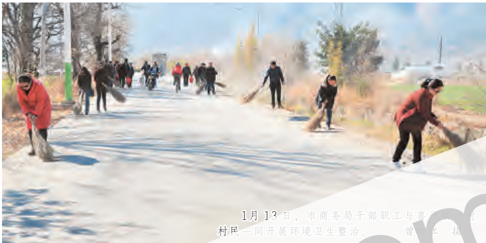
1月13日,市商务局干部职工与青年志愿者、市民一同开展环境卫生整治。

我市扎实开展“清洁家园、清洁水源、清洁田园”环境卫生整治活动 1月13日至20日,全市累计有35.4万人参加整治活动,累计清扫垃圾4785.5吨,垃圾清扫量比平时增加1038.43吨,日均增加137.3吨。通过活动的开展,城市道路显得更加靓丽、河流湖泊变得更加清澈、集镇村庄变得更加美丽,社区建设更加和谐,干部群众的文明素质有了新提高,大理的天更蓝、水更清、山更绿、空气更清新。