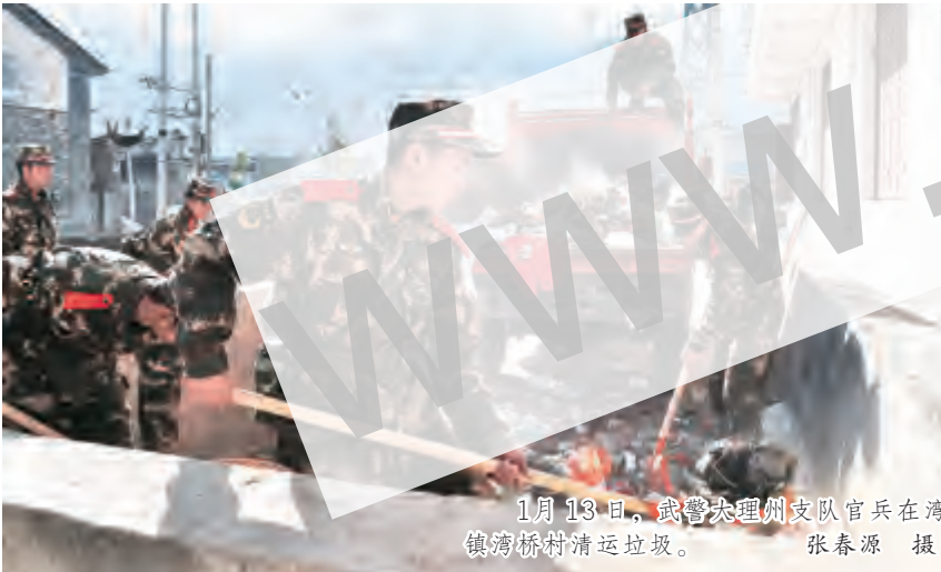
1月13日,武警大理州支队官兵在湾桥镇湾桥村清运垃圾。