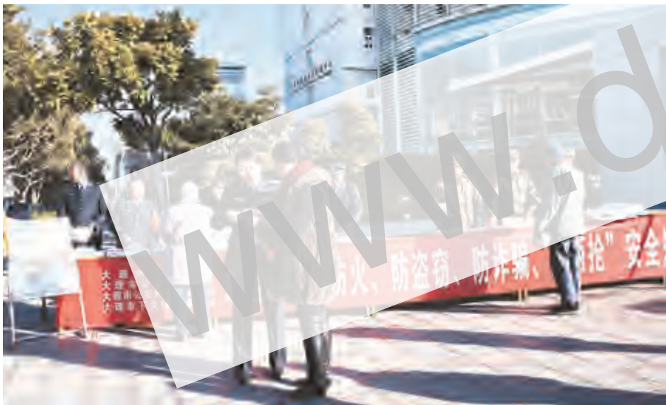
1月17日,龙溪社区与大理市消防支队、市公安局龙溪派出所在大理州医院,联合开展“防抢、防盗、防诈骗、防火”安全知识宣传活动,活动中共发放宣传资料5000多份,并提高了公民的防范意识和自我保护的意识。