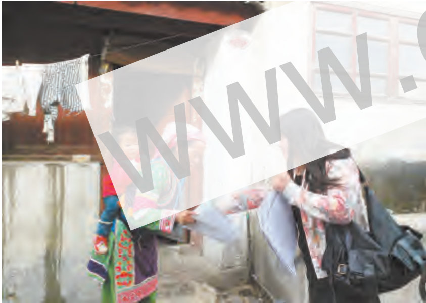
为拓宽城市社区民族工作新领域,下关镇关迺社区抓住“入户走访”及办理相关证明等时机,广泛宣传党的民族政策,增强社区内各族群众维护民族团结意识,同时积极为大邑乡大邑村党总支20多名彝族党员及100多名家属等外来人口做好服务管理工作,让他们主动参与到创建民族团结进步示范社区各项工作中,为社区和谐发展营造了良好社会环境。