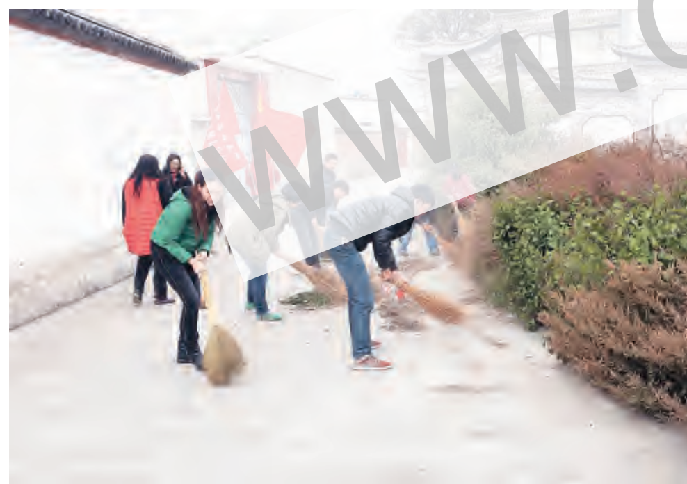
洱海保护工作是一项长期、艰巨的工作,“保护洱海母亲湖,组工干部在行动”活动是市委组织部长期坚持的一项行动。近日,市委组织部分部干部职工积极开展洱海保护清理环境工作,以自己的行动号召全市广大干部职工,进一步提升环保意识,从我做起、从身边小事做起,时刻不忘保护洱海,保护生态环境。