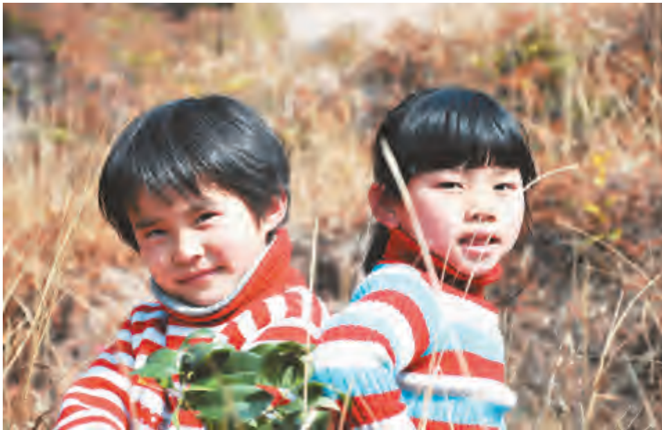
小伙伴们也呼朋引伴的聚在一起,尽情地追逐玩耍。

项目全搬到水池中来了,欢歌笑语,好不热闹。走出澡堂,我们个个眉清目秀,人人都有了新气象。新年到,点鞭炮;正月里,走亲戚;闹元宵,放天灯……乡村的寒假,多姿多彩,趣味盎然。儿时的寒假生活,没有各种兴趣爱好班,没有电脑、没有动漫,但却润浸着乡土气息的年味,它是释放童真的乐土。