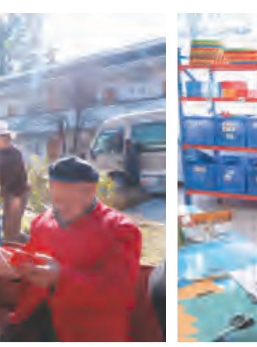
大理市领导深入基层开展走访慰问活动。

离开市第二人民医院,慰问组来到大理市中心敬老院,详细了解老人的生活起居情况。慰问组坐在老人们身边,同他们一一交谈,关切询问他们的身体状况、家庭情况和在敬老院的生活情况。听老人们说在敬老院里不仅衣食无忧,而且活动内容很丰富,慰问组十分高兴,真诚祝愿老人们幸福安康、健康长寿,并殷