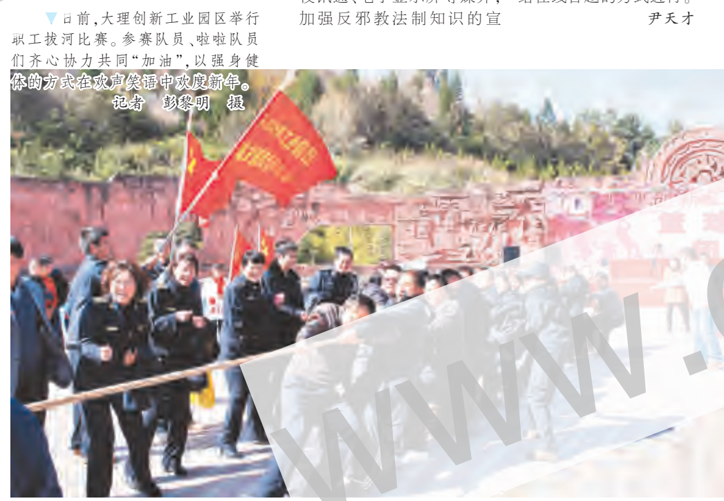
日前,大理创新工业园区举行职工拔河比赛。参赛队员、啦啦队员们齐心协力共同“加油”,以强身健体的方式在欢声笑语中欢度新年。

为在“六五”普法活动中宣传普及反邪教法制知识,进一步增强全市广大师生的法制意识,认清邪教的本质和危害,筑牢反邪、防邪的思想防线,市教育局高度重视、全面部署,在全市各学校广泛开展反邪教法制知识竞赛活动,取得实效。 活动中,市教育局专门下发《上网参加竞赛流程说明》,让全市100多所学校、25133名师生及时参加了竞赛。各学校充分将竞赛活动与电脑课有机融合,并利用校园广播、黑板报、校园网、校讯通、电子显示屏等媒介,加强反邪教法制知识的宣传。 尹天才