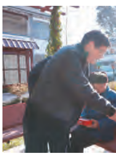
大理市领导深入基层开展走访慰问活动。

一大早,慰问组冒着冬日的寒风来到大理滇西纺织有限公司。厂房内,一台台先进的设备正在有条不紊地运转,慰问组同正在值守的工人代表一一握手,与他们进行亲切交谈,详细了解他们的工作、生活状况,给他们送上慰问金。得知企业拥有先进的生产设备,生产技术水平 and 产品质量都达到国内先进水平,产品附加值高、市场前景广阔后,慰问组十分高兴,充分肯定企业取得的成绩,同时也感谢他们为我市纺织业发展做出的贡献。