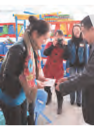
大理市领导深入基层开展走访慰问活动。

每到一处,慰问组都与大家亲切交谈,一边传递真情,一边关切鼓励。在市第三幼儿园和市老干部活动中心,慰问组对幼儿园的教师和老干部们为大理市发展所做出的贡献表示衷心感谢,并亲切询问他们的生活情况和身体健康状况,给他们送上慰问金和慰问品,向他们致以新年的祝福。慰问组希望老年朋友们老有所养、老有所依、老有所乐、老有所为,继续发挥余热,一如既往地关心关注大理市的改革发展。慰问组的关怀,使在场的人们深受感动,幸福写在每个人脸上。