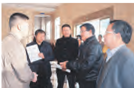
市领导调研欧亚乳业新厂区建设情况