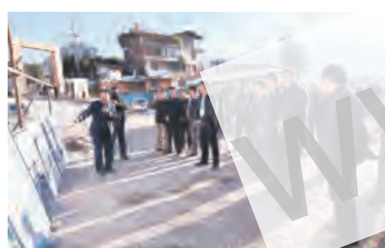
市领导在西大街文明街片区区域改造项目现场了解建设情况