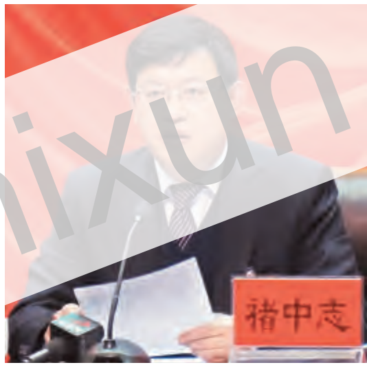
褚中志代表市委常委会作工作报告。

昨日，中共大理市委八届四次全体(扩大)会议举行。这次会议的主要任务是：以邓小平理论、“三个代表”重要思想、科学发展观为指导，认真学习贯彻党的十八大、十八届三中全会、中央经济工作会议、中央农村工作会议和省第九次党代会、省委九届七次全会、州市党代会、州对市调研会议精神，全面总结2013年工作，研究部署2014年各项任务，动员全市各级党组织和广大干部群众，认清形势谋划发展、稳中求进改革创新，为加快实现全市各族群众的美丽幸福之梦、全面建成小康社会而努力奋斗。 全委会由市委常委会主持。州委常委、市委书记褚中志代表市委常委会作工作报告，并在闭幕会上作总结讲话。市委副书记、市长李福安部署今年经济工作。 褚中志在报告中指出，2013年以来，