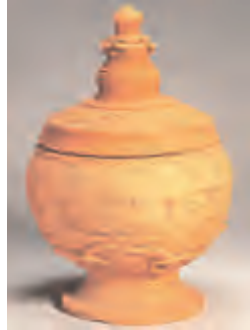
素陶火葬罐·大理国

大理绿桃村西出土。夹砂橙黄陶。盖空心火焰珠宝塔式钮。斜折边,拱顶。中饰刻划覆莲花纹四瓣。身无领,圆唇,子母口。腹部鼓圆,饰刻划四叶花纹八朵,中有十字分隔。下腹急收,饰堆塑仰莲纹四瓣。喇叭口,高圈足,上饰如意纹四瓣。口径14厘米,最大腹径24厘米,足径16厘米,通高32厘米。