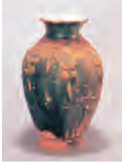
绿釉陶火葬罐·南诏

大理凤仪大丰乐墓地出土。圆唇高颈,矮圈足略外撇。肩部凸旋纹二道,旋纹间贴饰小宝相花加流云六朵,上腹部长短相间贴饰瓔珞。施釉不及底,口径12厘米,腹径20.8厘米,高29.2厘米。