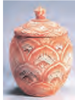
彩绘莲纹陶火葬罐·大理国

大理绿桃村西出土。夹砂橙黄陶质。盖火焰珠空心钮,圆环座,拱顶,折边,方唇。火焰珠钮上用红白相间颜料绘火焰燃烧状纹饰。盖内绘朱红法轮。身子母口内敛,鼓腹,椭圆形,平底。盖、身均用红白黑三色颜料绘莲花瓣纹。盖口径9.5厘米、高13厘米。身口径8厘米、腹径14厘米、底径10.4厘米、高28.5厘米。(资料由大理市博物馆提供)