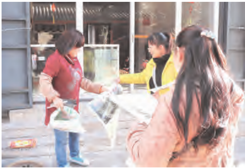
红山村进村路口,一块雕刻着“红山村”三个红色大字的巨大石头便屹立在村庄的路口。