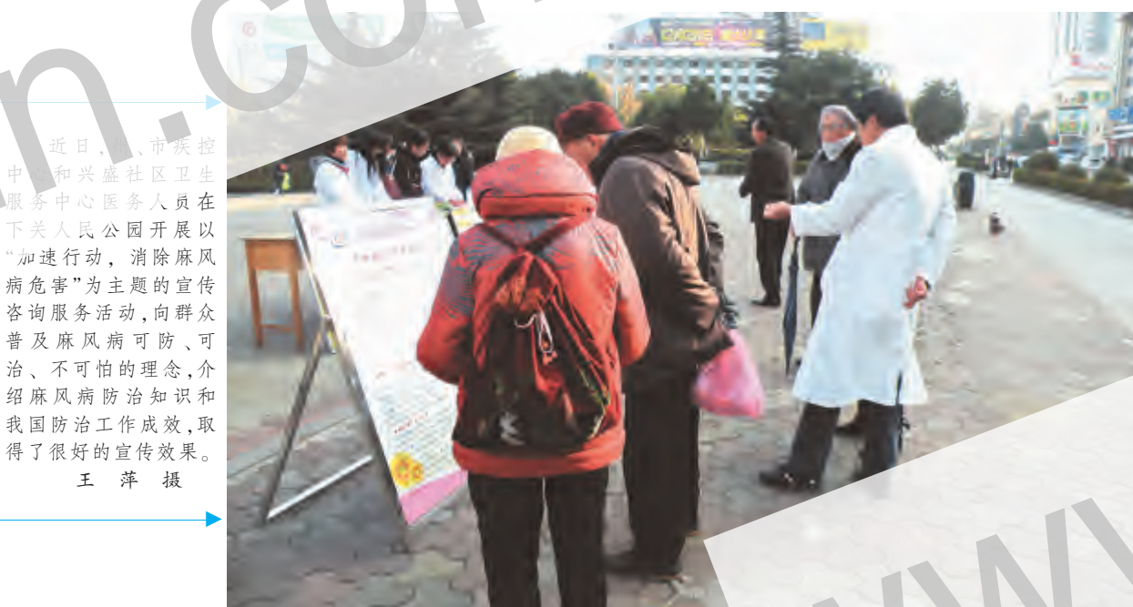
近日,大理市疾控中心联合兴盛社区卫生服务中心医务人员在下关人民公园开展以“加速行动,消除麻风病危害”为主题的宣传咨询服务活动,向群众普及麻风病可防、可治、不可怕的理念,介绍麻风病防治知识和我国防治工作成效,取得了很好的宣传效果。

旅游景区和基础设施建设有新突破。崇圣寺三塔文化旅游区完成国家标准试点工作;大理古城国家5A级景区创建工作通过省A评委实地初评,蝴蝶泉公园4A级旅游景区改造提升项目启动实施;大理古国历史文化旅游项目、高端酒店建设项目稳步推进,招商引资取得实质性进展。截止2013年12月底全市旅游接待床位数为54752个。行业管理取得新进展。完善星级饭店评定复核体系,完成海湾国际酒店5星级、34家旅游特色民居客栈和经济型酒店评定工作。加大市场监管执法力度,狠抓旅游安全生产专项整治,狠抓旅游投诉的调处、处理和回访