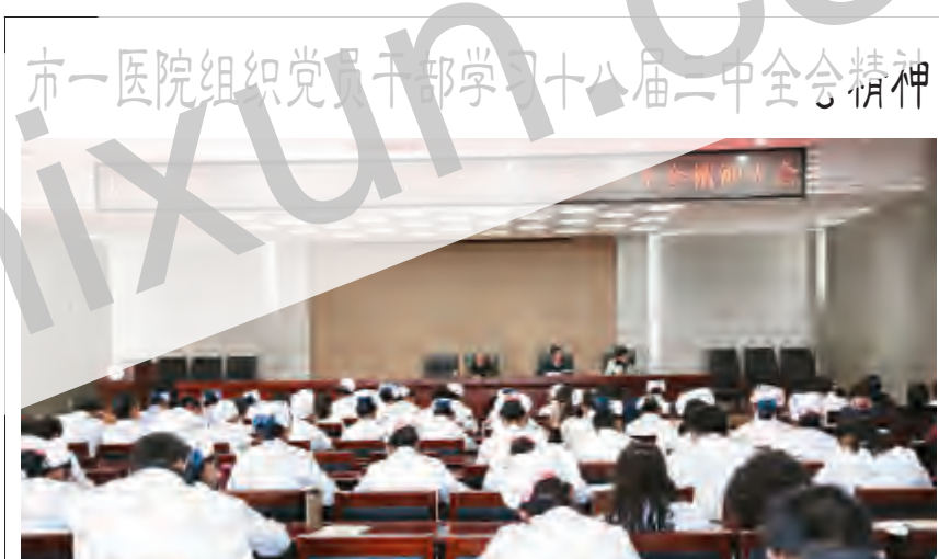
市一医院组织党员干部学习十八届三中全会精神

近日,市第一人民医院召开全体中层干部和党员会议,学习贯彻中国共产党第十八届中央委员会第三次全体会议精神,医院领导班子和 300 余名党员干部职工参加了学习。