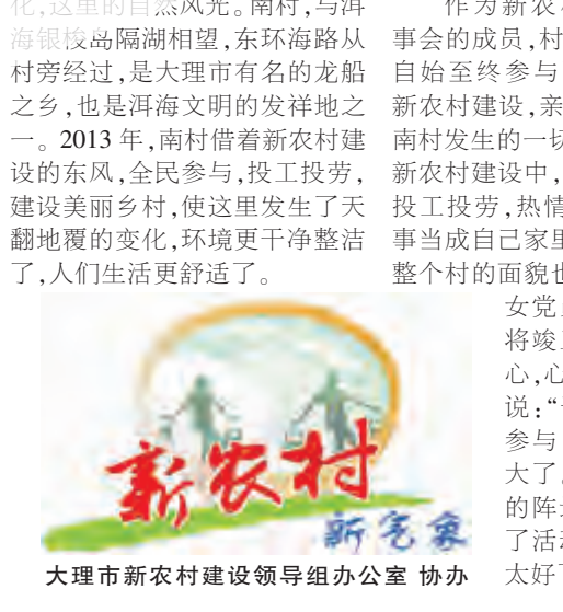
大理市新农村建设领导小组办公室 协办

宽敞笔直的进村道路,青瓦白墙的白族民居,古朴典雅的“银梭毓秀”牌坊,干净整洁的村容村貌,这里还建起了村民活动中心、公厕,安装了太阳能路灯,道路两旁种上了行道树。当我们来到这里时,被眼前的景象所陶醉。 在南村,这个洱海畔普通小乡村,在美丽乡村建设过程中发生了巨变,变得美丽、更加宜居。 南村,这个洱海畔普通小乡村,在美丽乡村建设过程中发生了巨变,变得美丽、更加宜居。 南村,这个洱海畔普通小乡村,在美丽乡村建设过程中发生了巨变,变得美丽、更加宜居。