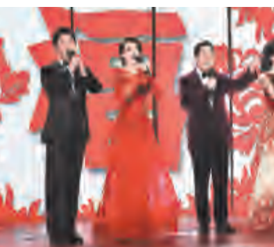
地址:大理市下关苍山路23号 办公室电话:2183183

亮点二:绿叶 语言类节目一向是春晚上的重头戏,今年语言类节目只保留了五个。很多网友戏称“不像春晚,倒像一场