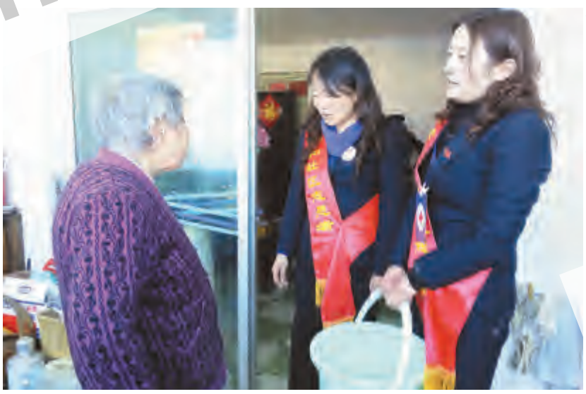
“谢谢你们,辛苦了!”近日,下关镇宁和社区工作人员在给家住文化路原滇纺宿舍的老人送水后,老人感动地这样说。据了解,近期,文化路原滇纺宿舍片区有时出现停水情况,宁和社区开展自愿者送爱心服务,为老人开展上门送水。

日前,市住建局针对雨雪过后天气变冷的特点,在抓好日常监督检查的同时,进一步强化监管措施,科学指导,确保冬季施工安全。 加强领导,做好冬季安全生产工作。以抓好“冬季施工安全”为核心,提高认识,加强领导,保持警惕,从实际出发,组织布置冬季施工安全工作。制定应对特殊天气的应急预案,明确职责,落实措施,切实抓好季节性施工安全生产工作,确保冬季施工安全。 开展教育,提高建筑从业者的自我保护意识。建设、施工、监理单位将冬季安全生产工作列入重要议事日程,利用安全教育、技术交底、职工夜校等形式,进行全员安全教育培训,扎实认真地排查和消除隐患,培训教育与专项检查相结合,提高冬季安全防范能力和处置突发事件及自我保护能力。 明确重点,做好冬季安全生产管理工作。针对冬季施工特点,要求各施工单位以“防火、防冻、防滑、防坠落”为重点,强化冬季安全生产管理。 加强监督检查,落实安全生产责任制。结合冬季施工特点,有针对性地开展冬季施工安全检查,从技术上和管理上,对施工现场深基坑、模板支撑、脚手架搭设、起重机械设备等重点环节和部位,进行全面排查整改、跟踪监控,做好“回头看”工作。对安全管理科定期不定期地深入施工现场,检查工程中的安全工作,发现存在重大安全隐患的,果断采取措施,该停工的停工,该处理的处理,确保不发生责任事故。